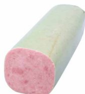
Puten Pizzablock, Stange 100x100 Art. Nr. 230.400, ca. 3,8 kg