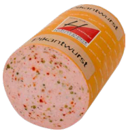
Pikantwurst, Stange Art. Nr. 230.130, ca. 3 kg