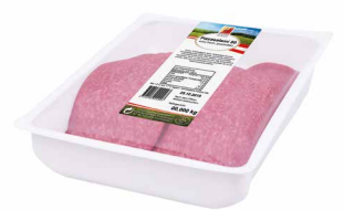
Pizzasalami Kal. 80, extra frisch, geschnitten Art. Nr. 260.191 1000 g / Packung, ASP