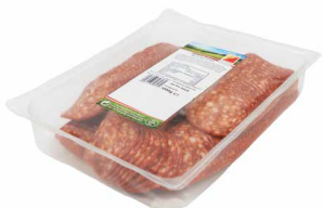
Salami Piccante Art. Nr. 260.647 1000 g / Packung, ASP