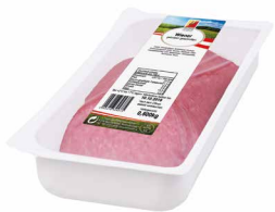
Wiener, geschnitten Art. Nr. 230.537, 500 g

Unser Fleischbrät wird unter Berücksichtigung von Kundenwünschen in einer großen Vielfalt an Sorten und Geschmacksrichtungen hergestellt. Das Produkt wird speziell nach Ihren Anforderungen maßgeschneidert.