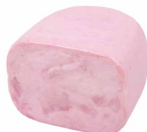
Meisterschinken, halbiert, ca. 160x105 Art. Nr. 250.219, ca. 2,4 - 2,6 kg