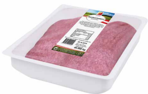
Sandwichsalami Kal. 80, geschnitten Art. Nr. 260.104 1000 g / Packung, ASP

Ausgewählte und qualitativ hochwertige Rohstoffe garantieren die ausgezeichnete Spitzenqualität unserer Salamiprodukte. Unterschiedliche Würzmischungen veredeln unser Sortiment. Von mild bis würzig und aromatisch ist für jeden Geschmack und Bedarf das Richtige dabei. Unsere Qualitätssalami reift nach modernsten Standards im traditionellen Naturreifeverfahren im Buchenrauch und wird zudem besonders schonend luftgetrocknet.