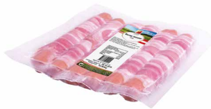
Berner Würstel Art. Nr. 211.776, 1200 g vac. verpackt