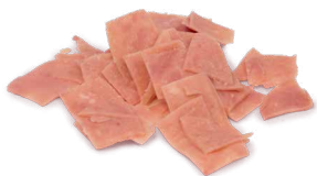
Pizzablock gerissen, im Beutel Art. Nr. 250.514, ca. 1.500 g