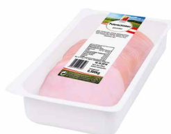
Putenschinken geschnitten Art. Nr. 230.176, 500 g