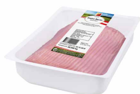
Gastro Bacon, geschnitten