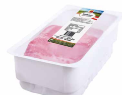
Rindfleisch gepökelt, geschnitten

Art. Nr. 160.152 ca. 2 kg / vac. verpackt