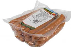
Frankfurter 10 Paar (1,2kg) Art. Nr. 220.067, ASP verpackt