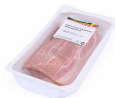
Bacon Exquisit, geschnitten