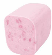
Pizzablock EXPORT Stange 100x100 Art. Nr. 250.515, ca. 3,8 kg