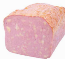
Käs Leberkäs, halbiert Art. Nr. 220.106, 1500 g vac. verpackt