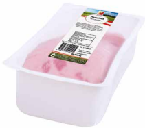
Pizzablock 100x100, geschnitten Art. Nr. 250.512, 1000 g