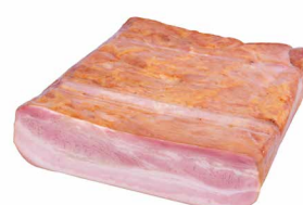
Gastro Bacon, halbiert

Art. Nr. 160.152 ca. 2 kg / vac. verpackt