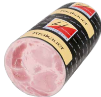
Krakauer, Stange Art. Nr. 230.170, ca. 3 kg