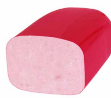
Prosciutto ital. Art 120x150, Stange Art. Nr. 250.603, ca. 5 kg