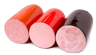
Aufschnitt 3/2 Art. Nr. 230.519, ca. 4,5 kg vac. verpackt