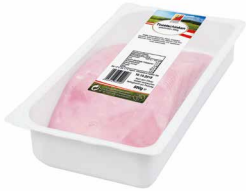
Toastschinken geschnitten Art. Nr. 250.215, 500 g

Nach der akribischen Qualitätsprüfung werden in unserem Fleisch-Standardisierungszentrum in Reichenthal die Fleischteile für die Schinkenproduktion entsprechend vorbereitet; zerlegt, fein zugeputzt und gepökelt. Nachdem der Rohstoff soweit vorbereitet ist, werden unsere Schinken je nach Anforderung und Geschmacksrichtung veredelt und sorgfältig verarbeitet, gekocht und geräuchert oder nur gekocht – auch diese Entscheidung treffen unsere Kunden.