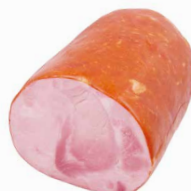
Saunaschinken halbiert, ca. 140x115 (oval) Art. Nr. 250.125, ca. 2,5 kg