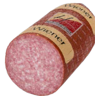
Wiener, Stange Art. Nr. 230.530, ca. 2 kg