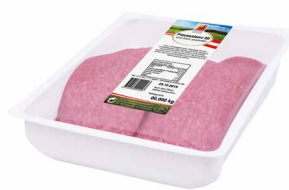
Pizzasalami Kal. 65, extra frisch, geschnitten Art. Nr. 260.190 1000 g / Packung, ASP