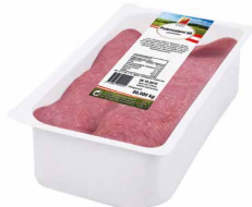
Putensalami Kal. 65, geschnitten Art. Nr. 260.505 1000 g / Packung, ASP