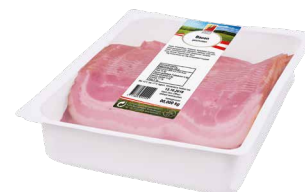
Bacon Exquisit, geschnitten