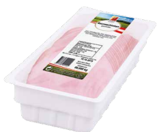
Saunaschinken geschnitten Art. Nr. 250.101, 1000 g