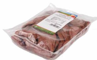
Rindersalami 50, geschnitten Art. Nr. 260.574 1000 g / Packung, ASP