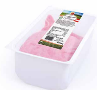
Puten Pizzablock, geschnitten, 1000g Art. Nr. 230.401 / Packung, ASP