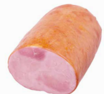
Frühstücksschinken, halbiert, ca. 115x85 (oval) Art. Nr. 250.127, ca. 1,5 - 1,8 kg