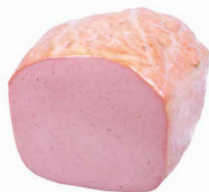
Leberkäse, halbiert Art. Nr. 220.104, 1500 g vac. verpackt