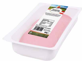
Extrawurst geschnitten Art. Nr. 230.107, 500g