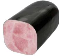
Toastschinken 100x100, halbiert Art. Nr. 250.216, ca. 1,7 - 2,1 kg