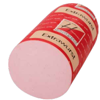
Extrawurst, Stange Art. Nr. 230.100, ca. 3 kg