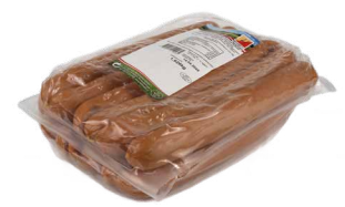
Käsekrainer ca 1,8kg Art. Nr. 220.089, ASP verpackt