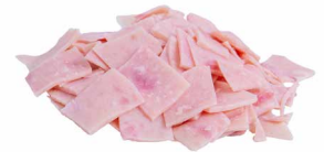
Toastschinken gerissen, im Beutel Art. Nr. 250.202, ca. 1.500 g